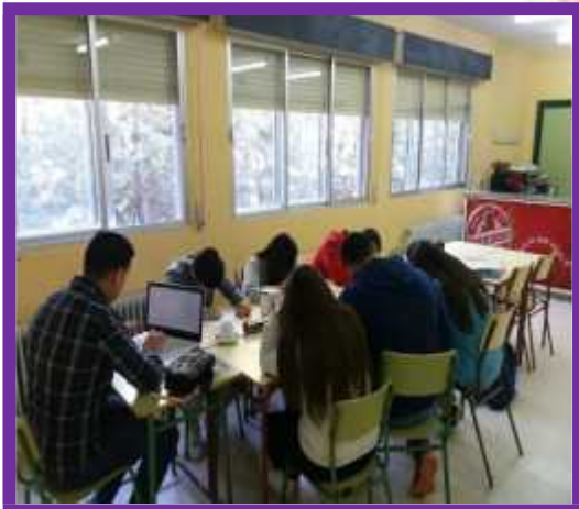
Alumnos de 2º FPB de cocina y restauración IES RAMÓN GIRALDO

Encargos en el edificio de cocina del IES RAMÓN GIRALDO y por nuestras cuentas en redes sociales. Correo electrónico: tokorroko@gmail.com